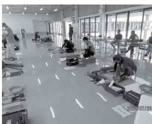
☆技能検定 (令和五年度)

受検者の皆さんには、事前に静岡県板事務所から、「実技講習会への参加希望の有無について」のご案内する予定であります。