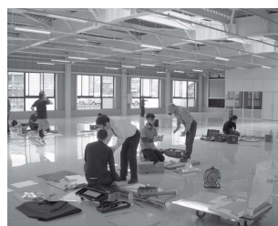
☆講習会 (令和五年度)

技講習会を、六月八日(土)と六月九日(日)の2日間、静岡県立工科短期大学校(旧清水技術専門学校)で開催する予定です。