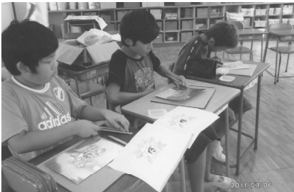
沼津市立片浜小学校

日連続で、2校の指導に当たったが、5日位間隔を置くなど配慮して欲しい。」「今後は、作品の課題を、花、植物、動物、鳥、表札など増やして行きたい。などの意見が寄せられました。