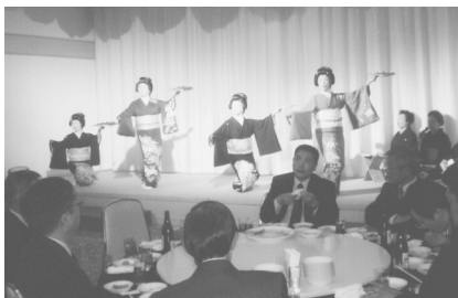
芸者さんもお出ましで、新年会場をすっかり魅了させました。