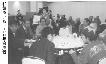
和気あいあいの新年会風景