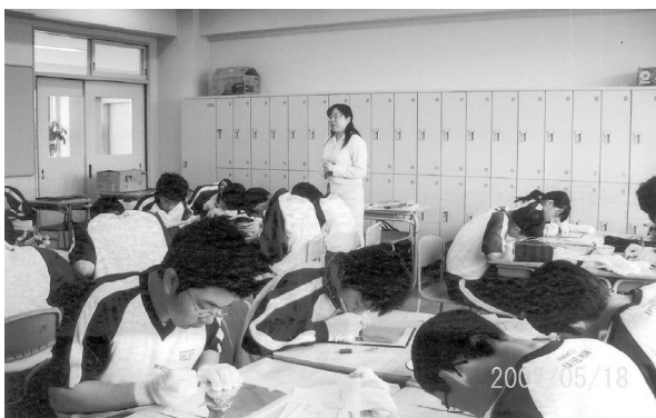
開誠館中学校 WAZA教室