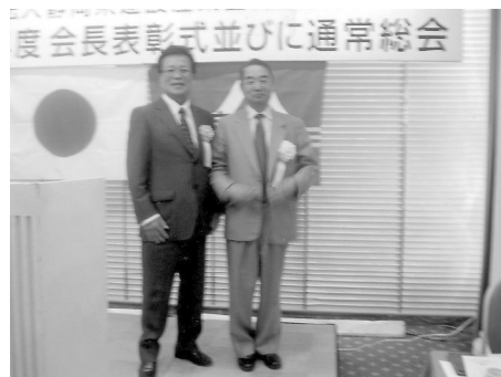
建産連会長と受賞をよろこぶ!