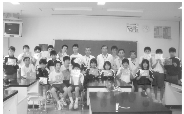
沼津市立第二中学校 WAZA教室

19年度WAZA教室 銅板へらだし)は沼津市立第二中学校(6月8日)、沼津市立第五中学校(6月29日)に実施しました。沼津市立第二中学校では私も指導責任者として参加させていただきました。ありがとうございました。生徒さんたちも銅板へらだし(つる)の作品を仕立て、良い体験が出来たと思います。