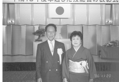
大臣表彰の宮崎理事長夫妻