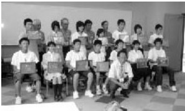
WAZA教室の選手たちが銅板へら出し「鶴」を手にとり並ぶ