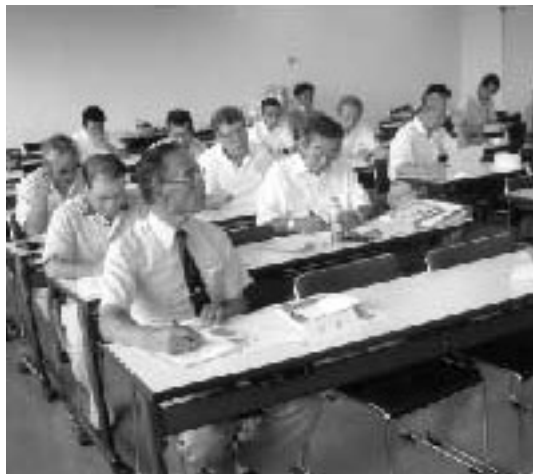
熱心に討議する出席の役員