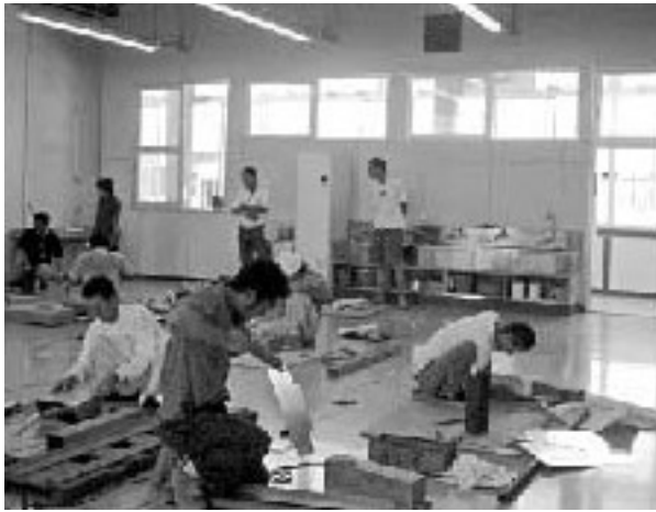
競技大会で課題に取り組む選手たち

実際に授業を受ける生徒も、銅板へら出しを初めて行なう生徒ですから、私たちの指導の通り、一つ一つの行程を忠実に守り、無駄口も訊かず途中休憩もせず、一心銅板に向かつて作業をしています、この様な生徒を見ますと、参加している生徒全員良い作品が出来ればと思います。今年も、ワザ教室を行なった学校の、銅板へら出しに参加した全生徒から、お礼の文章が届きました、初めて体験する銅