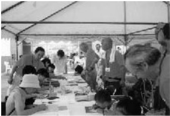
《体験コーナー》 銅板へら出しに精出す子供たちと指導に当る組合員