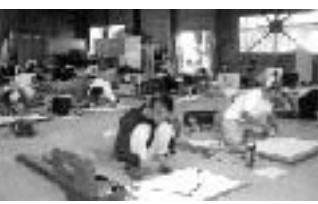
一級の課題に取り組む受験者

16年度の技能検定実技試験は、ポリテクセンター静岡(静岡市登呂)において七月十六日実施された。今回の受験者は、内外装1級22名、2級15名、ダクト1級4名合計41名であった。常日頃の技能と講習会で磨いた腕を振るって挑戦したが、合否の結果は十月上旬には静岡県職業能力開発協会から発表される予定になっている。写真は検定試験に挑戦中の受験者たち。